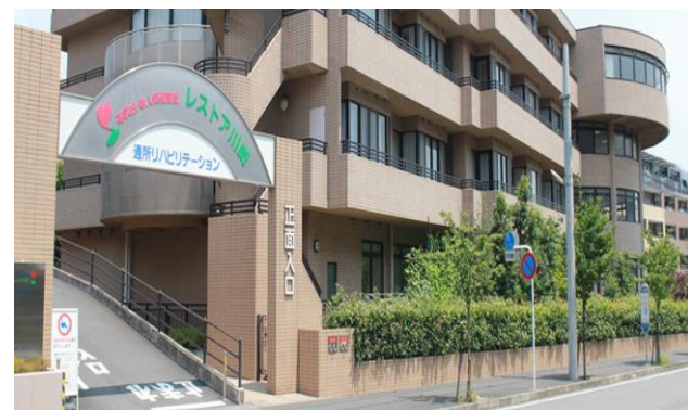
レストア川崎 (老健)