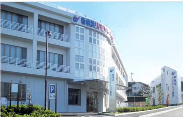
新横浜リハビリ テーション病院 (回復期)