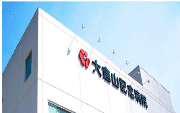
大倉山記念病院 (回復期)