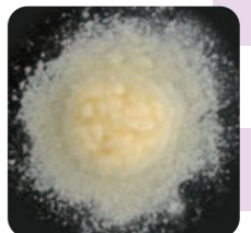
水ですぐ溶けます