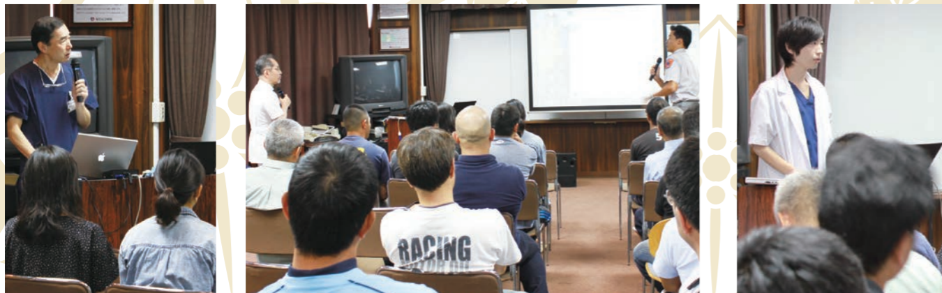
病院と救急隊が共同して地域医療に貢献することが大切であるとあらためて感じた交換会でした。

横浜市の救急隊員約40名にお集まりいただき意見交換会を行いました。救急隊員より救急要請を受けてから医療機関へ搬送するまでの流れをわかりやすく教えていただきました。また、当院に搬送された患者さまの症例に基づき活発な意見交換を行うことができました。