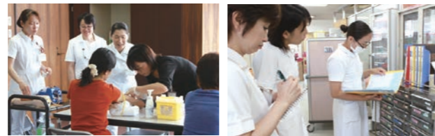
前回の復帰支援プログラムの様子