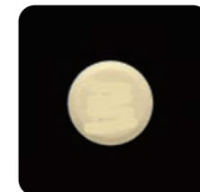
このような錠剤が

お薬を作るときに細かい穴をあける、崩れやすくする成分を混ぜて成型する、などの工夫で写真のように少量の水でほろほろと崩れるお薬ができるのです。