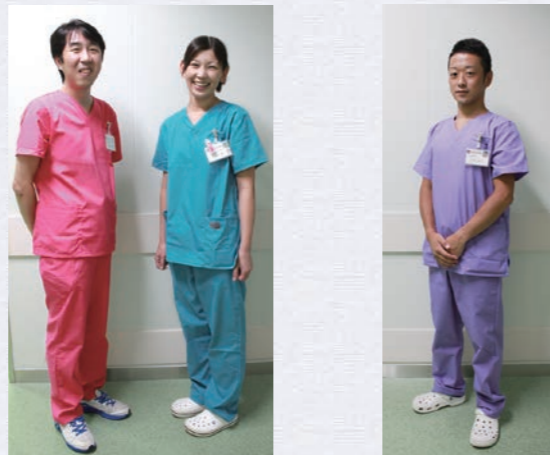
看護師・准看護師

2013年9月2日(月)より看護部のユニフォームを変更いたしました。どうぞよろしくお願ひ致します。