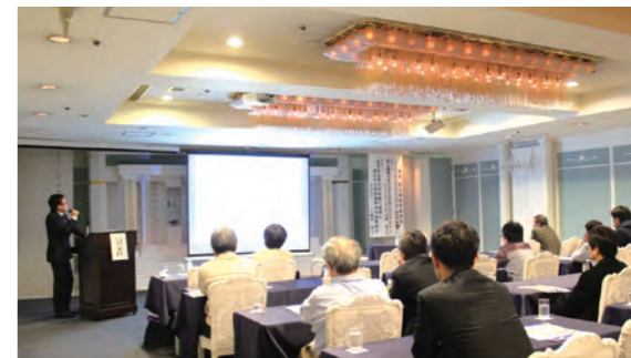
講演名『前立腺肥大症に対する手術とセルニルトン』

このような講演会を通して、患者さまに最適な医療を提供できるよう医療技術の向上に努めていきたいと考えております。