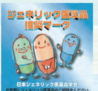
▲ジェネリック医薬品推奨マーク