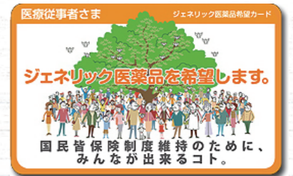
▲ジェネリック医薬品希望カード

何かご不安なことや、疑問に思うことがございましたら、お気軽に薬剤師にご相談いただければと思います。